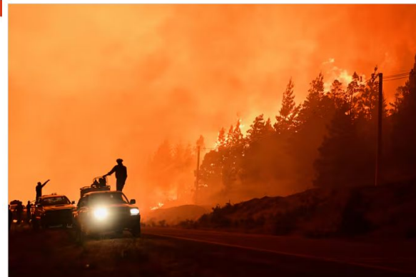
Bomberos voluntarios trabajaron de forma incansable para combatir los incendios forestales El Hoyo

“Ese dinero es aportado por la población a través del pago de sus seguros, y el Estado nacional lo administra y distribuye entre los cuarteles y asociaciones que cumplen con los requisitos administrativos previstos por la normativa”, aclaró Oliva. Desde la federación insistieron en la importancia de que los cobros y pagos del financiamiento legal “se realicen con previsibilidad y normalidad, para que los cuarteles puedan planificar y sostener sus servicios esenciales sin inconvenientes ”.