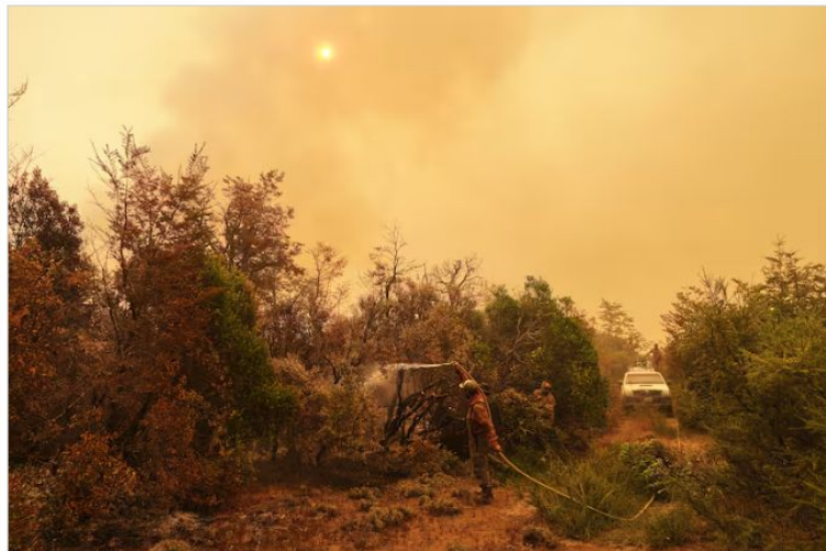
El bombero voluntario Lucas Panak combate incendios forestales en Cholila

Chubut es una de las provincias en la que dos grandes incendios forestales activos llevan arrasadas más de 40.000 hectáreas en las últimas semanas.